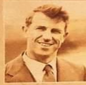
Sir Edmund Hillary