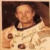
Neil A. Armstrong