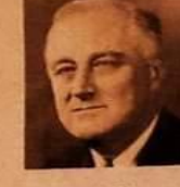
Franklin D. Roosevelt