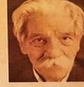
Dr. Albert Schweitzer