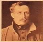
Albert I King