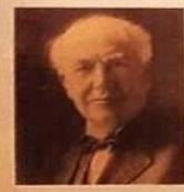
Thomas A. Edison