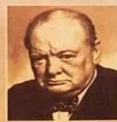
Sir Winston Churchill