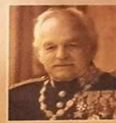
Prince Rainier III